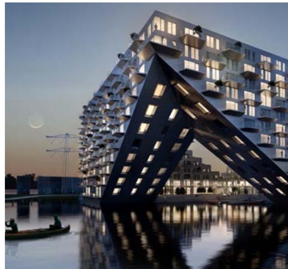
Sluishuis in Amsterdam

urgente kwesties voor VORM zijn: de impact van de bouw op het klimaat, overmatig gebruik van grondstoffen, het verlies van ecosystemen in onze leefomgeving en het tekort aan betaalbare woningen. Opgaven die onze kwaliteit van leven direct beïnvloeden. Dit vraagt om anders denken én doen. Wij willen dat onze kinderen over 40 jaar ook kunnen genieten van een gezonde leefomgeving vol dieren en planten.