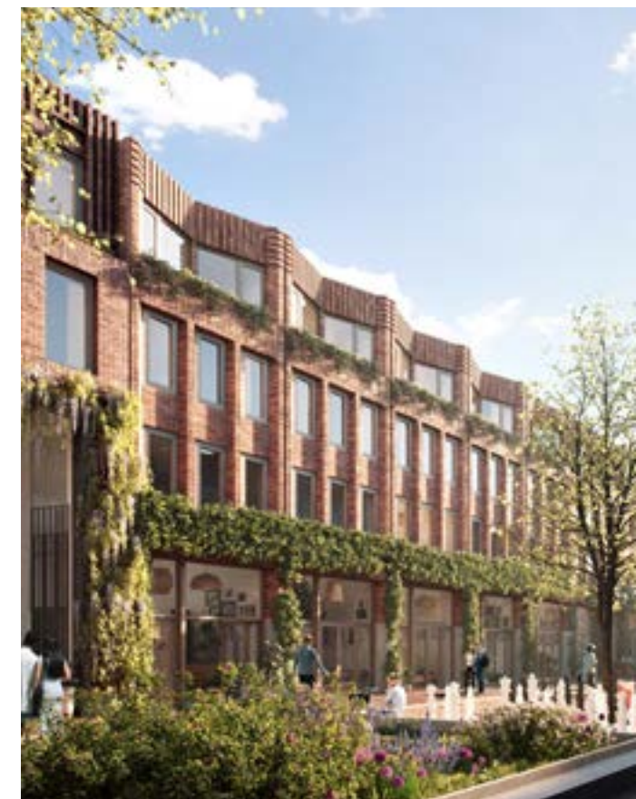
Carré II in Utrecht, gebouwd vanuit de filosofie: "eerst gebruikmaken van het beschikbare"