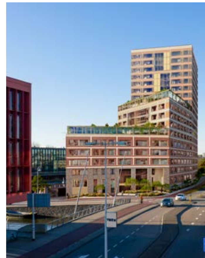
Fibonacci in Amsterdam - duurzaam gebouwd door VORM 2050