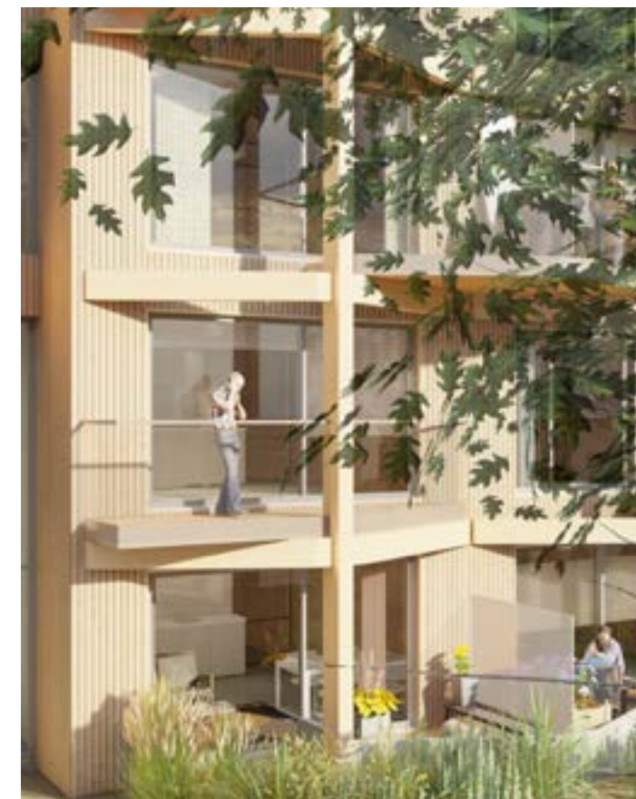
De Veerweg in Papendrecht, volledig opgetrokken uit CLT