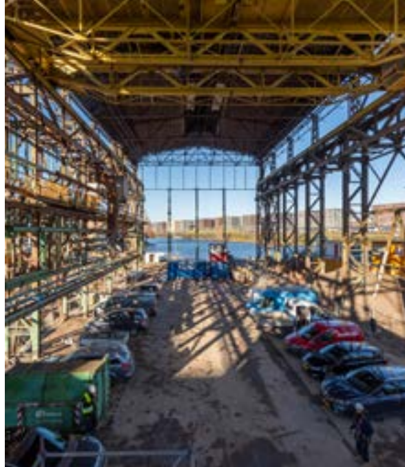
De Werksparhal op Oostenburg krijgt een nieuwe bestemming