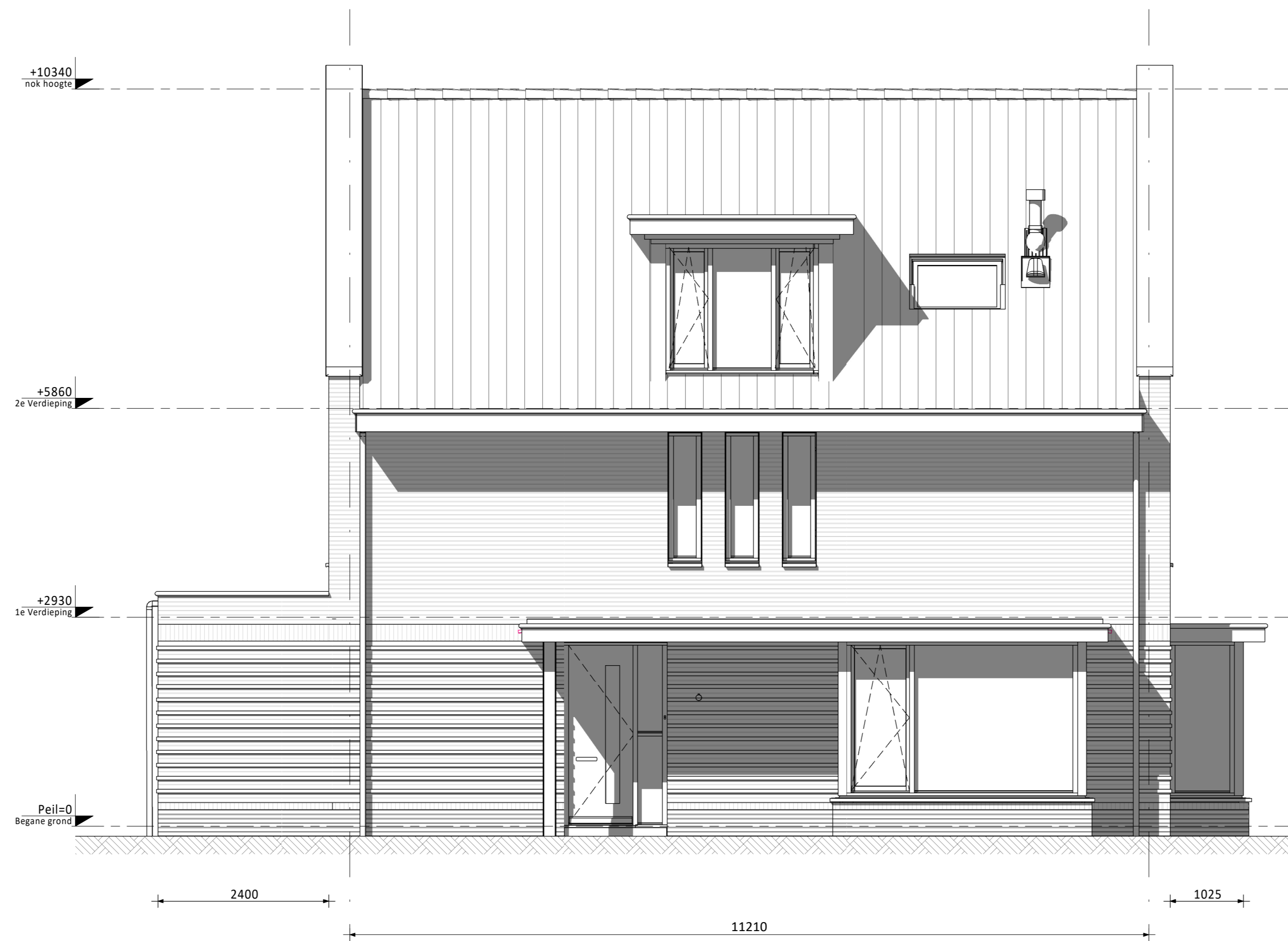
Entreegevel (B) • Aanbouw achterzijde 2,4m • Erker voorzijde