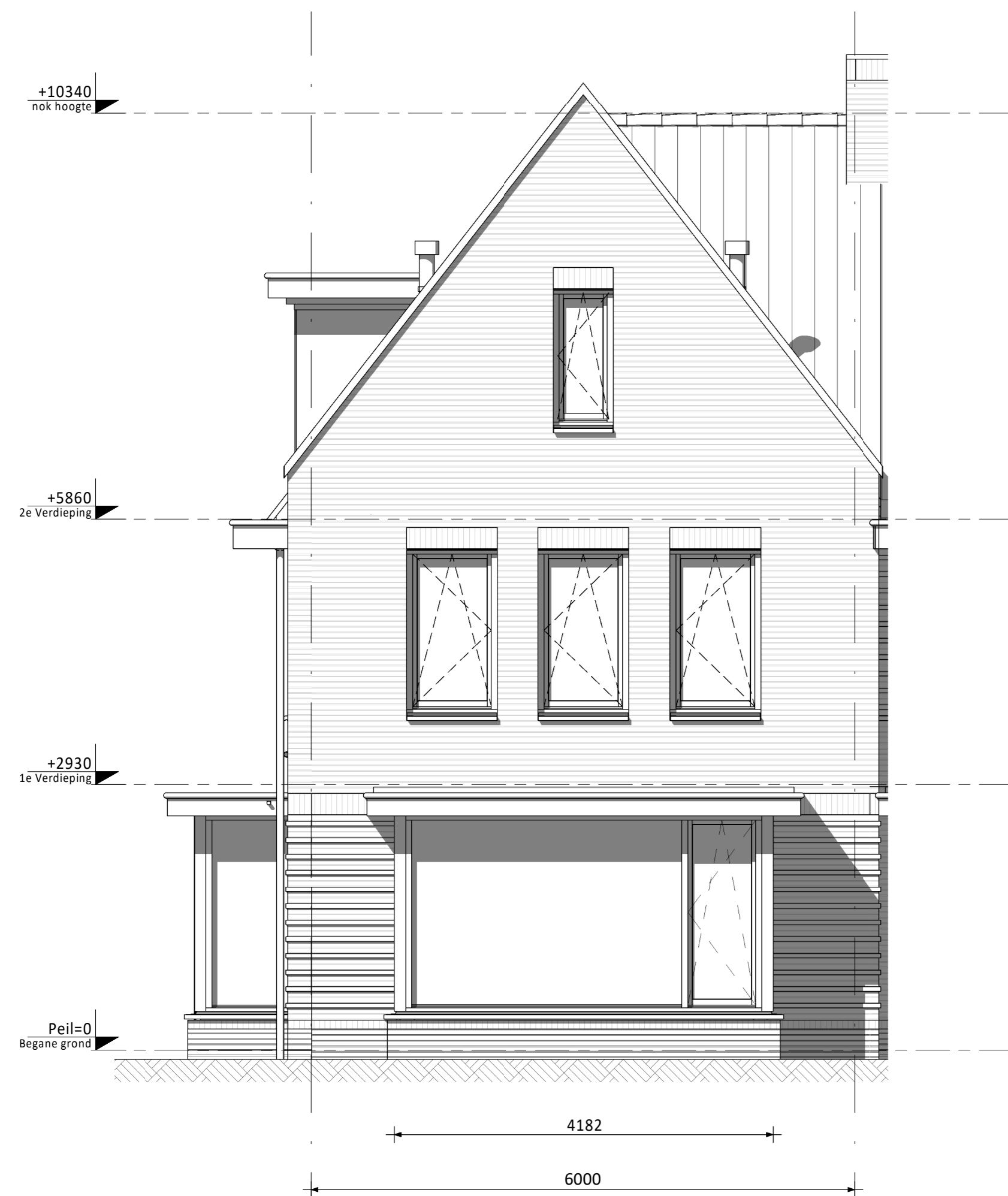
Voorgevel (as) • Erker voorzijde