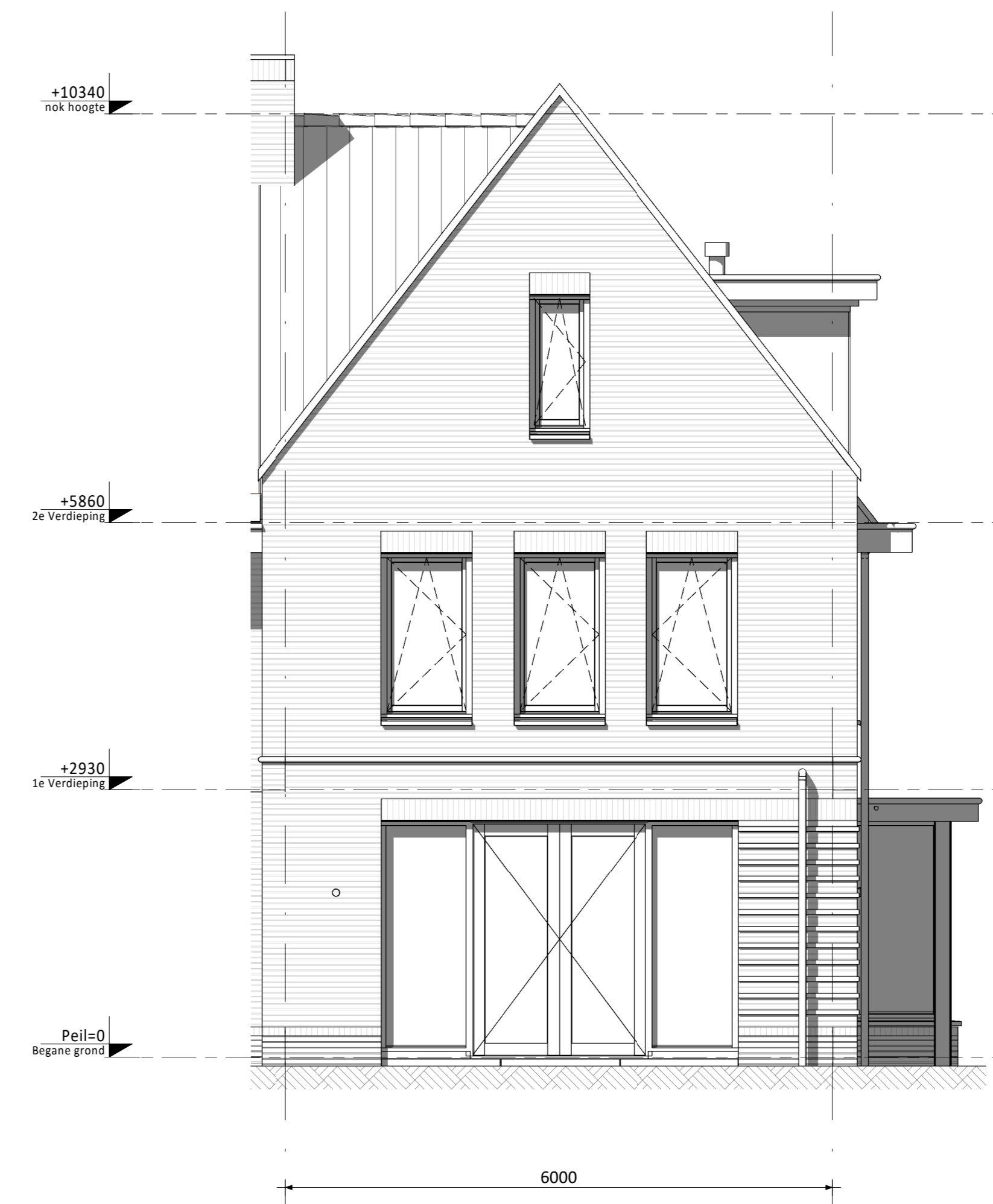
Achtergevel (as) • Aanbouw achterzijde 2,4m

PV-panelen: aantal en situering indicatief (n.t.b. afhankelijk van EPC berekening) Zie tekening VK-B0601 voor aantal PV-panelen per bouwnummer