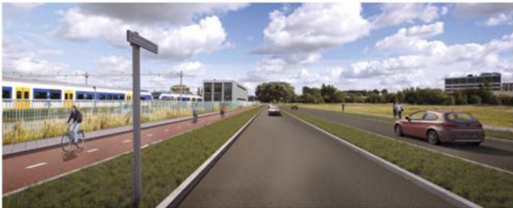
Voorbeeld wegbeeld stedelijke hoofdweg 2x1 rijstrook: Spoorboogweg (toekomstige inrichting)